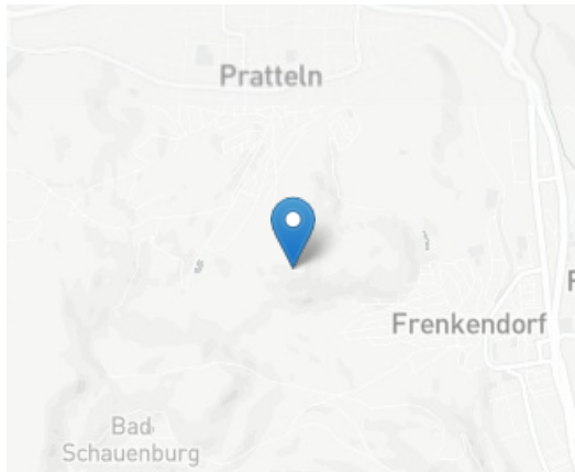
Ruine Madeln 4133 Pratteln

Die Ruine Madeln steht auf der höchsten Stelle des Adlerbergs in Pratteln.